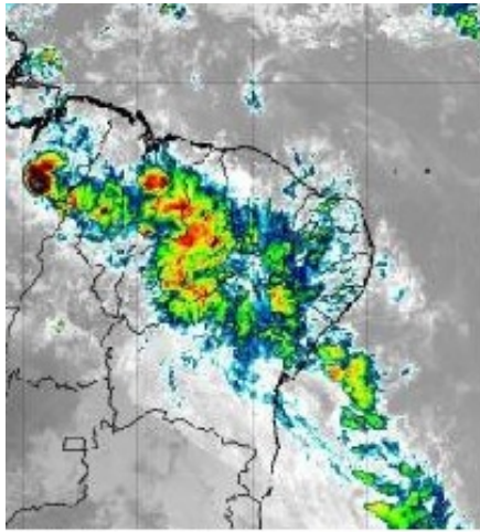
Satélite GOES em 04/11/2022 as 9:30h.

O setor centro/oeste da Paraíba encontra-se com muitas nuvens associadas à configuração dos ventos em altos e médios níveis da atmosfera. Com isso, são esperadas chuvas isoladas nas regiões do Alto Sertão, Sertão e Cariri, podendo se estender de forma mais isolada para as regiões do Agreste e Brejo. As temperaturas máximas registradas na tarde de ontem em Areia; 30,6°C, Cabaceiras; 33,7°C, Campina Grande; 32,3°C, João Pessoa; 32,4°C, Monteiro; 33,8°C, Patos; 38,1°C e São Gonçalo; 36,8°C e, as mínimas registradas na madrugada de hoje em Areia; 20,4°C, Cabaceiras; 22,1°C, Campina Grande; 21,2°C, João Pessoa; 25,1°C, Monteiro; 20,4°C e São Gonçalo; 23,6°C. Fonte: INMET e AESA.