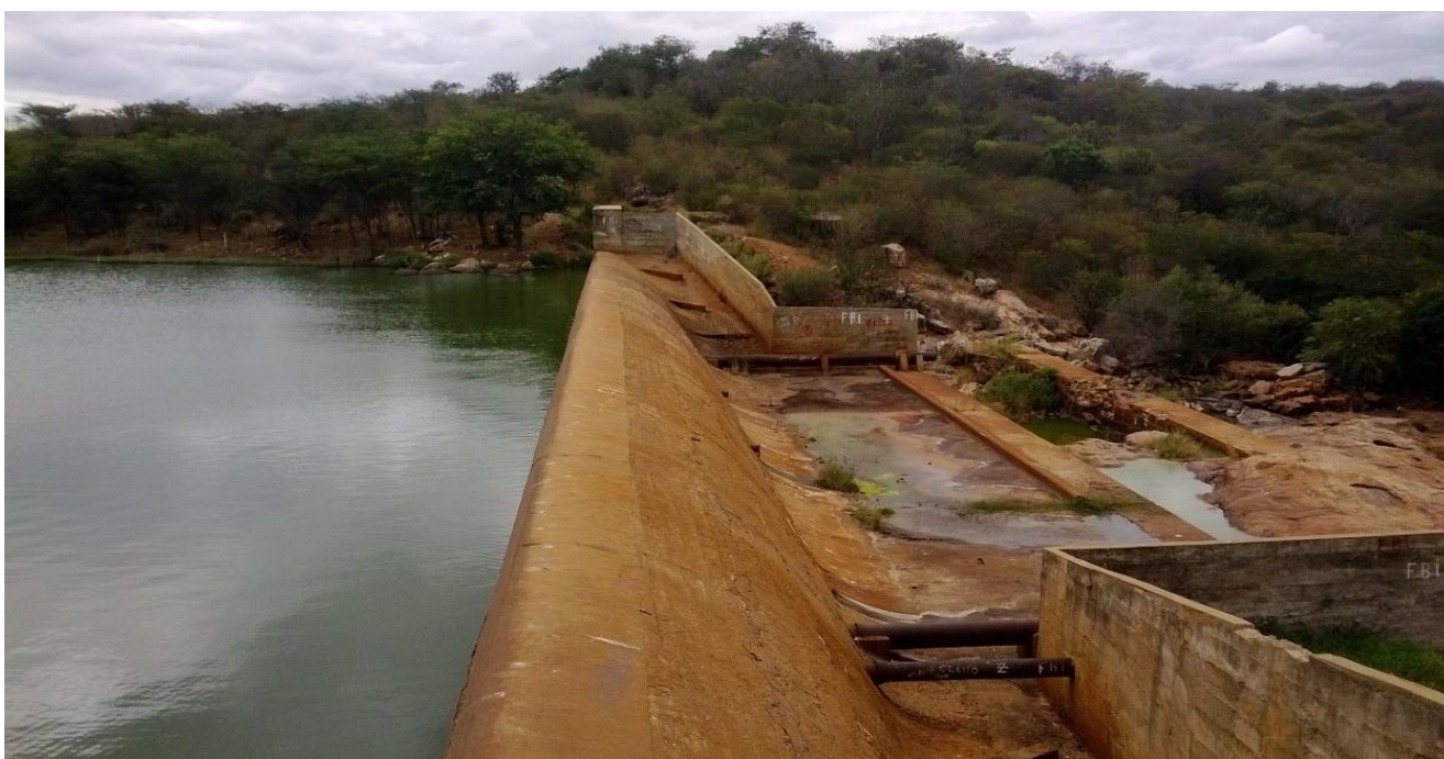
Açude São José - Monteiro