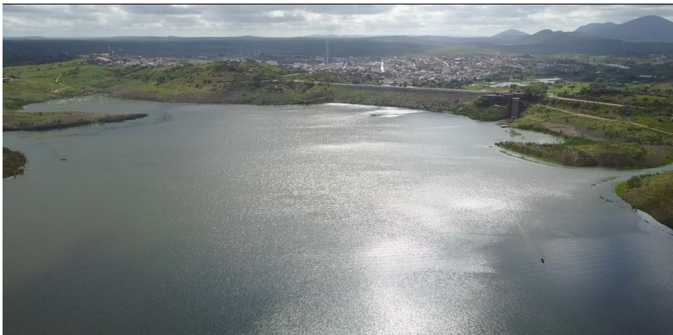
Açude Epitácio Pessoa – Boqueirão